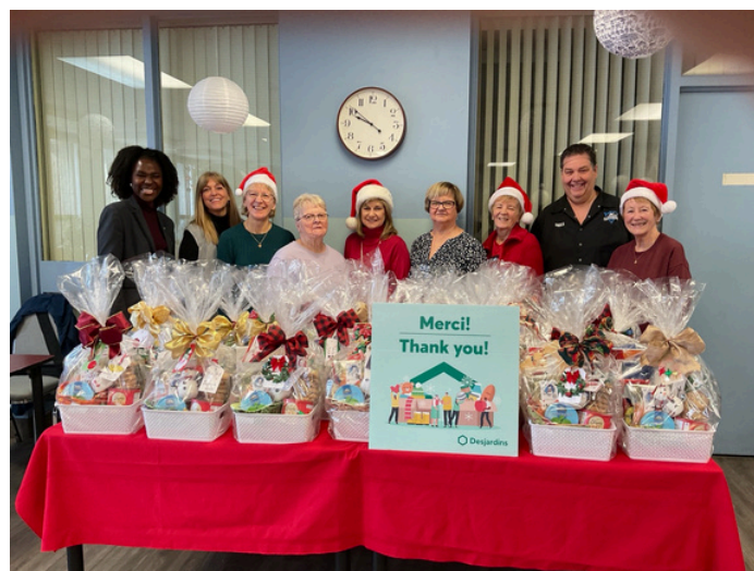
Un total de 40 paniers a été remis !

Une équipe de bénévoles a participé à cette campagne permettant de souligner la résilience de nos membres en leur offrant un panier réconfortant remplis de belles surprises. De plus, les élèves de l'école élémentaire publique L'Odysée ont pris un moment pour écrire un mot réconfortant.